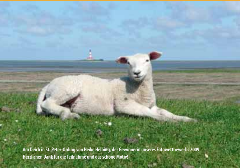
Am Deich in St. Peter-Ording von Heike Helbing, der Gewinnerin unseres Fotowettbewerbs 2009. Herzlichen Dank für die Teilnahme und das schöne Motiv!